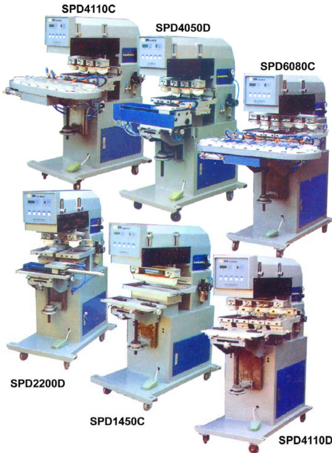
Машины напольного типа