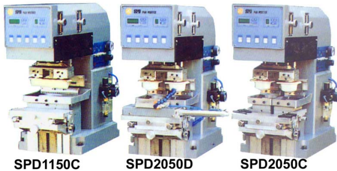
Машины настольного типа