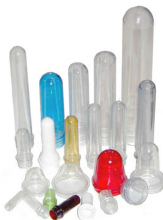
Диапазон раздуваемых преформ 5 – 250 г