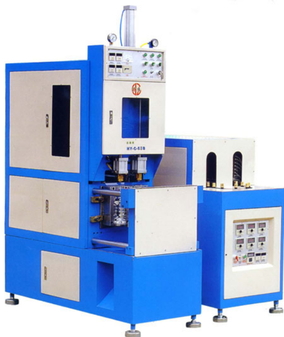
Машина выдува ПЭТ емкостей Н2С5