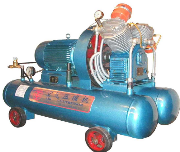
Компрессор поршневой V0.6/25