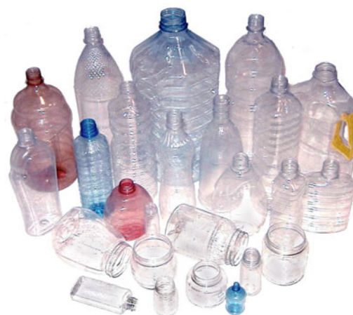
Примеры производимых емкостей различного назначения