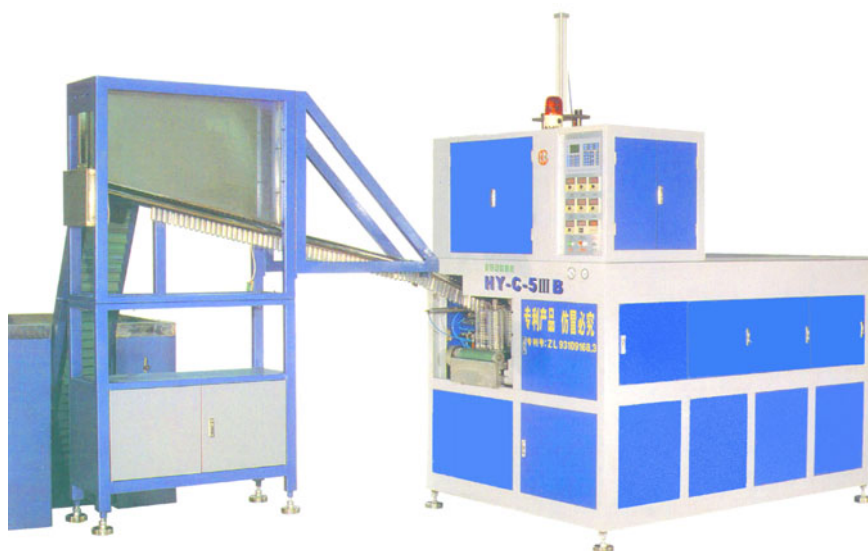
Автомат выдува НС-5 III В с устройством автозагрузки