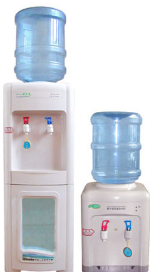
Кулеры- диспенсеры для дома и офиса

Бизнес в области розлива и доставки чистой питьевой воды находится у нас лишь в стадии формирования, в то время как в развитых и в развивающихся странах горячая и холодная чистая вода в доме и офисе является привычным делом. Даже в Китае оборот бутылей превышает наш отечественный в 50 раз на душу населения!