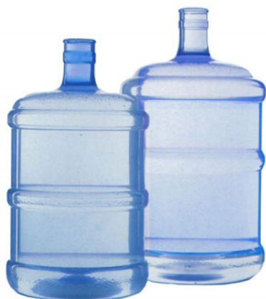
Пример многооборотных бутылей для питьевой воды емкостью 3 и 5 галлонов