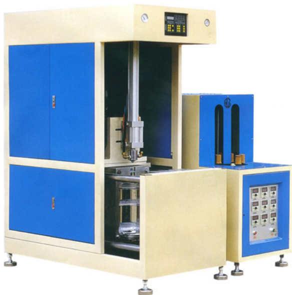
Машина выдува ПЭТ бутылей НС-5 II С

Производство многооборотных бутылей из ПЭТ рентабельней производства традиционных бутылей из поликарбоната в несколько раз!!!